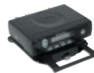
Monture à Glissière Amovible

Les radios mobiles polyvalentes de la Série Commerciale conviennent particulièrement pour les sociétés de taxis, de Messagerie et de Livraison pour lesquelles la Transmission de données permet une diffusion rapide des informations des passagers et des informations livraison. Les options de montage permettent d'enlever facilement et rapidement la radio quand le véhicule n'est pas utilisé. Pour les entreprises travaillant pour l'agriculture, l'environnement ou l'écologie, les travailleurs isolés sont protégés par les dispositifs de sécurité intégrés de manière à ce que l'aide et les conseils des collègues soient accessibles par simple appui sur une touche. Pour les communautés urbaines, l'appel individuel est idéal pour le contact entre le superviseur et les membres de l'équipe sans déranger les collègues occupés.