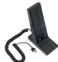
Microphone Noir de Bureau