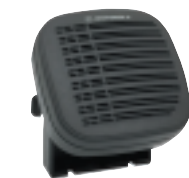
Haut-parleur Externe 13W