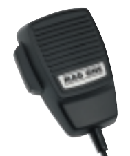
Microphone Mag One