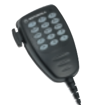
Microphone à Clavier de Téléphone