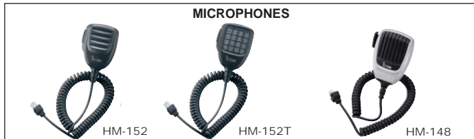
HM-152 : Microphone simple HM-152T : Microphone DTMF HM-148 : Microphone dynamique pour utilisation intensive