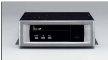
Module canal supplémentaire UR-FR5000 (VHF) ou UR-FR6000 (UHF) pour série IC-FR5100