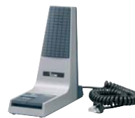
SM-25 : Microphone de table

Les spécifications et informations données dans ce document peuvent être modifiées sans préavis.