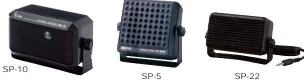
SP-5 : Haut-parleur grand modèle SP-10 : Haut-parleur SP-22 : Haut-parleur compact