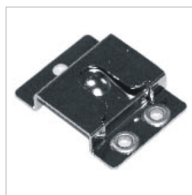
Support de microphone