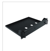
Support de fixation BRK08