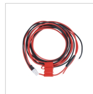
Cordon d'alimentation PWC10