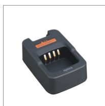
Chargeur MCU à débit rapide CH10A04