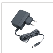
Alimentation à découpage PS1018