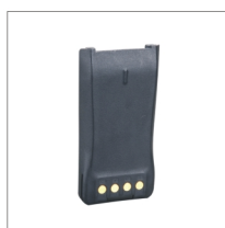
Batterie Li-ion (2000 mAh) BL2006