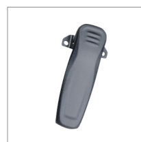
Clip ceinture BC19