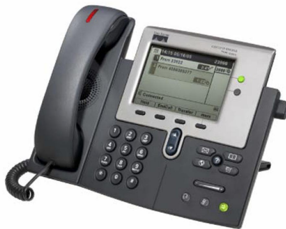
Figure 1. Le téléphone IP Cisco Unified 7941G-GE

Capable de fournir une bande passante illimitée à vos applications de bureau, le téléphone IP Cisco® Unified 7941G-GE est équipé des plus récentes technologies et des derniers progrès de la téléphonie VoIP Gigabit Ethernet. Avec son port Gigabit Ethernet pour l'intégration avec un PC ou un serveur de bureau (Figure 1), il permet à vos utilisateurs d'accéder rapidement aux données et aux applications du réseau. Disposant de fonctions identiques à celles du Cisco 7941G, ce téléphone IP Gigabit Ethernet amélioré pour l'entreprise présente deux boutons rétroéclairés programmables pour des lignes ou des fonctions et quatre touches interactives programmables qui guident l'utilisateur à travers les diverses caractéristiques et fonctions de l'appel. Il offre aussi des réglages audio pour les hauts parleurs duplex de haute qualité, le combiné et le casque. Son grand écran LCD de grande résolution à échelle de gris permet d'accéder facilement aux informations de communication, aux applications optimisées et aux diverses fonctionnalités de l'appareil (Figure 2). Il donne également aux utilisateurs et aux développeurs la possibilité d'installer à l'écran davantage d'applications innovantes et productives en langage XML (Extensible Markup Language) et peut afficher à l'écran des langues à « double octet ».